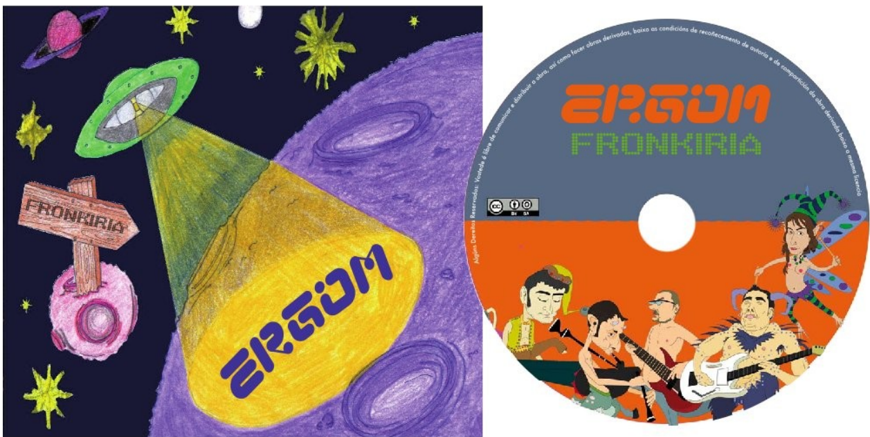
Portada e galleta de Fronkiria